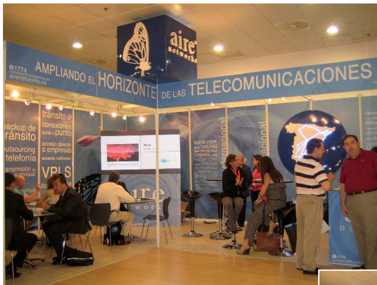
Aire Networks tuvo uno de los principales stands de la FERIA de AOTEC con gran afluencia de público

“Tenemos que reflexionar sobre la suerte que tienen las poblaciones donde damos un servicio cercano, de calidad y con una atención especial que es