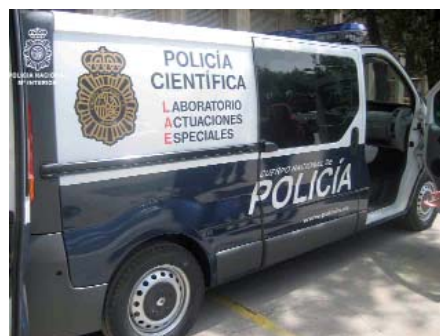
El canal de Chello Multicanal Crimen & Investigación se puso en marcha el pasado mes de febrero y ya emite una serie de producción propia sobre las diferentes unidades especiales de la Policía Nacional

Chello Multicanal patrocinó uno de los almuerzos, amenizado por un coctelero malabarista. La mayor productora de canales temáticos de pago de España