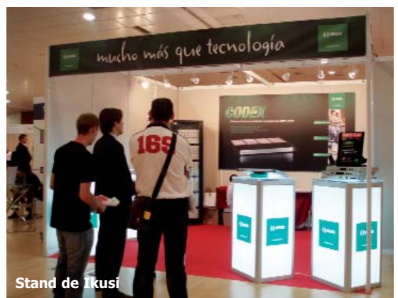
Stand de Ixusi