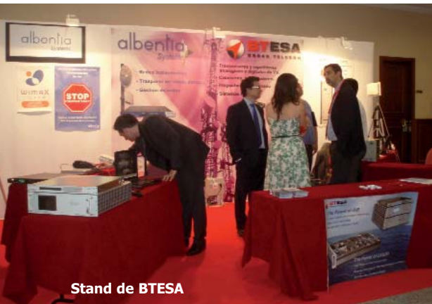
Stand de BTESA

punto de lanzar la nueva versión de su página web, más sencilla y dinámica, con un completo servicio de prensa y con una sección destinada a que los clientes de Aire Networks informen sobre sus actividades, lo que aporta gran valor añadido a un site que ofrecerá datos de los servicios de la compañía. Además de anunciar el próximo lanzamiento de TV por satélite, Aire Networks ha abierto red en Centroeuropa con el fin de reforzar los acuerdos internacionales, aportar redundancia a