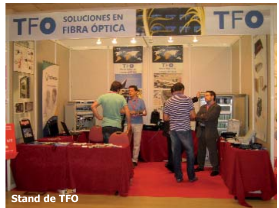
Stand de TFO

Technetix presentó diversos elementos para MoCA® para la optimización de la red interior de cliente, orientados a facilitar la distribución de señal de video, datos y entretenimiento en general a través del cable coaxial existente en la vivienda, MoCA® soporta múltiples streams de video HD entregando hasta 175 Mbps reales a través de todas las tomas de