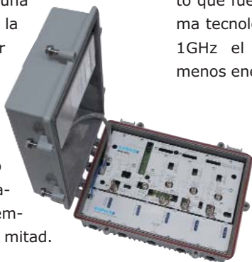
Amplificador Digital Broadband Edge 1000 (DBE-1000) de Technetix

Fte maximal exponía en el stand la unidad de telecontrol RCM 310 y una fuente redundada SPS 310 D. Además, ha desarrollado el medidor de campo para cable mediaMAX MINI, ligero, compacto y de uso intuitivo, con función Datalogger y la genuina MAP (Meter Aided Programming). La compañía ya cuenta con delegaciones en Francia, Italia, Dubai y Portugal, y ahora trabaja por abrir mercado en Rusia. Recientemente ha lanzado una nueva