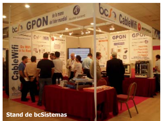
Stand de bcSistemas