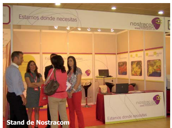
Stand de Nostracom